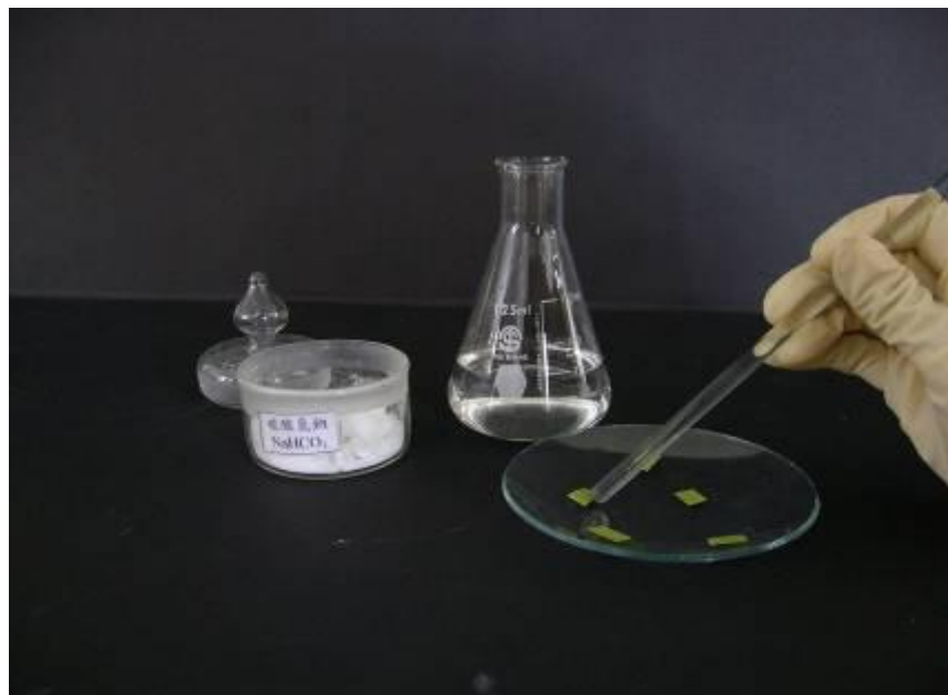
圖 2-2 以碳酸氫鈉控制酸鹼度