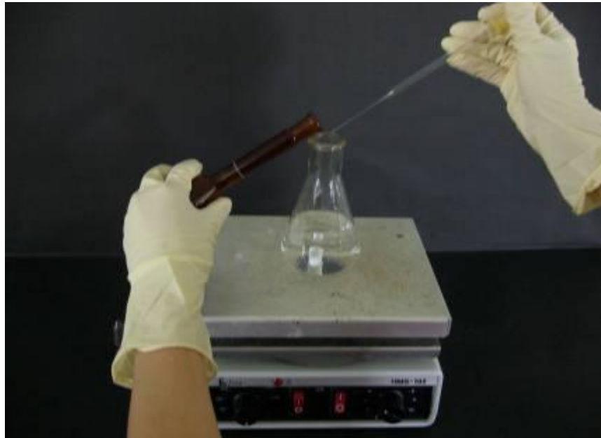
圖 2-1 重量滴定分析

學習莫耳(Mohr method)沉澱滴定法，利用氯化銀沉澱的產生，測定未知物樣品中氯離子的含量，並熟悉重量滴定法(weight titration method)。