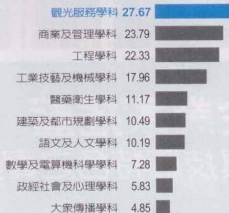
表6 個人表現比學校名氣，更具加分作用

你認為未來十年，哪些科系的大學畢業生在就業市場上較熱門？【複選】（%）（此表僅列出排名前10選項）