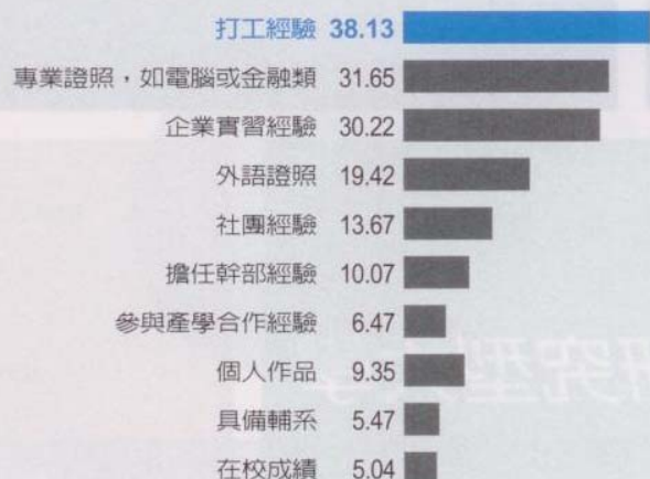
表7 觀光人才未來十年最搶手

你進用大學社會新鮮人時，哪些條件較具加分作用？【複選】（%） （此表僅列出排名前10選項）