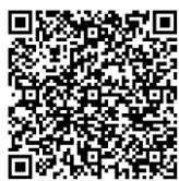
端木愷校長獎學金