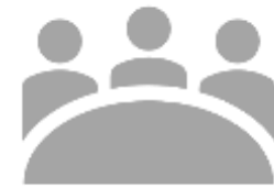
同學（方案實習夥伴）