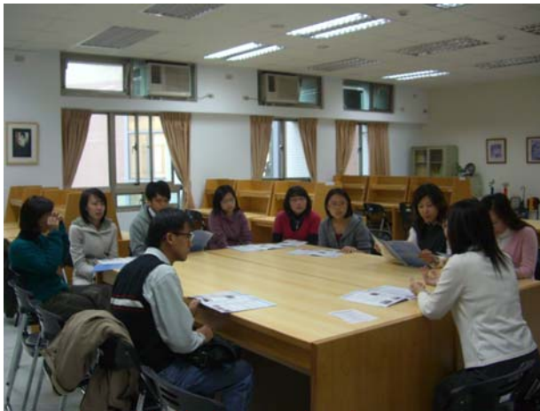
系友撥冗來校接受評鑑晤談，感溫啊～