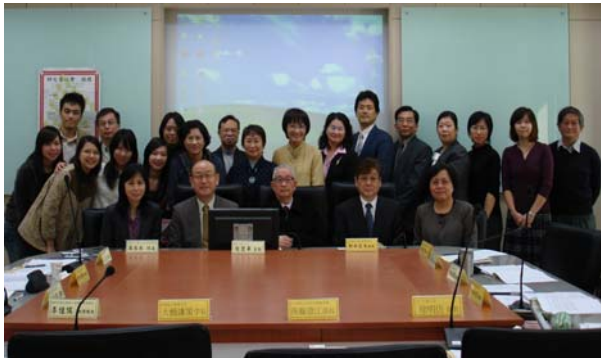
上午研究座談會大合照