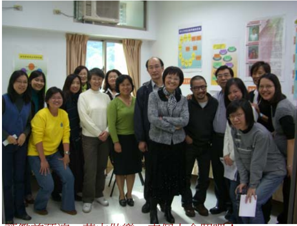
評鑑前預演，苦中做樂，來個大合照吧！