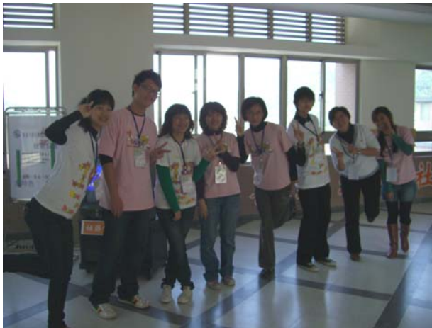
熱情洋溢的評鑑服務團同學，讚喔！