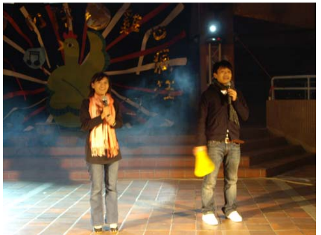
社工系系友-網路名人：蔡阿嘎 & 藏鏡人