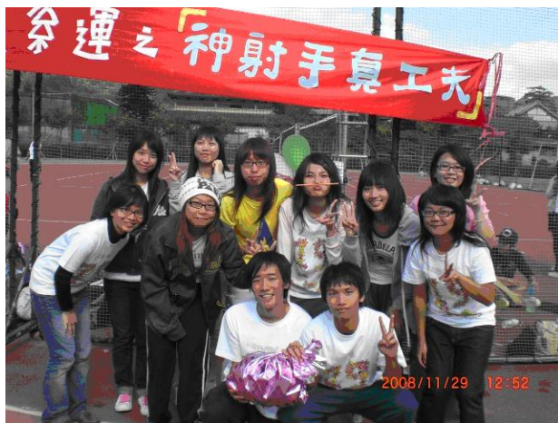
社工系系運比賽選手合照