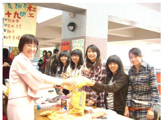
社工週於綜合大樓二樓擺台情形